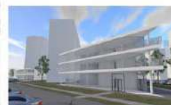
Строения В (2 этажа) - 1250,14 м 2