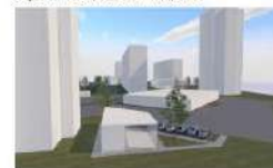
Строение С (1 этаж) - 136,6 м 2